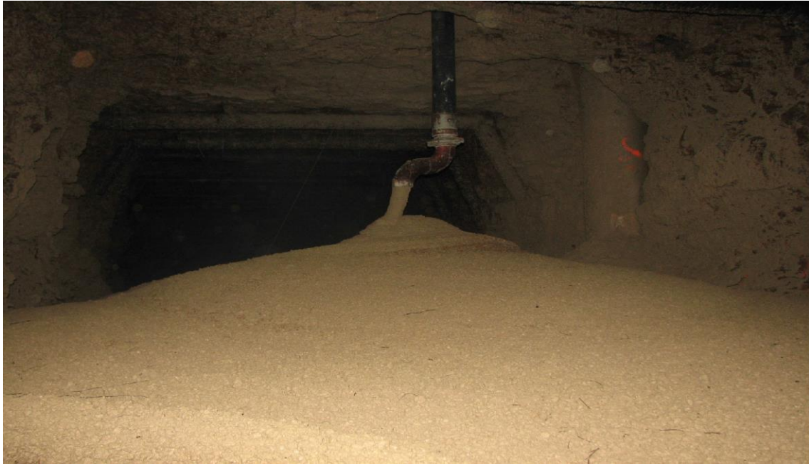
Joonis 27-2 Põlevkivikaevanduse hüdrauliline täitmine [28].

Põlevkivituhk moodustab aastasest Eesti ohtlike jäätmete tekkest 63 % (siia pole sisse arvestatud teisi põlevkivitööstuses tekkivaid jäätmeid nagu poolkoks) [15]. Mujal Euroopas käsitletakse erinevalt Eestist elektrijaamades tahkete fossiilkütuste (süsi, pruunsüsi) põletamisel tekkivat tuhka kui kõrvalsaadust, samas kui Eestis on see ohtlik jääde [21]. Kui tavajäätme taaskasutamisel peab selle tarbijal olema jäätmeluba, siis ohtliku jäätmega toormena realiseerimisel kaasneb ostjale veel hulk ametkondlikku asjaajamist käitluslitsentsi taotlemiseks. Ohtlike jäätmete nimekirjas olemine piirab põlevkivituha taaskasutamist [20]. Samuti pole välja antud ülevaatlikku kogumikku põlevkivituha taaskasutamist reguleerivatest õigusaktidest. Ülevaate tegemine antud teemal võib muuta põlevkivituha taaskasutamise atraktiivsemaks kuna vähendab ajamahukat seadusandluse uurimise vajadust. Selline kogumik aitaks vältida ka seadustega vastuollu sattumist põlevkivituha taaskasutamisel. Käesoleva töö eesmärgiks oli anda ülevaade põlevkivituha taaskasutamise seotud regulatsioonidest, aktidest ja direktiividest Euroopa Liidu ning Eesti Vabariigi seadusandluses.