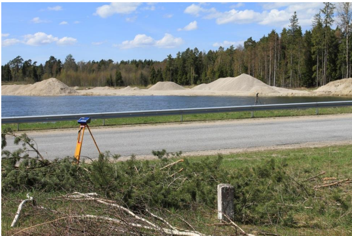
Joonis 11-1. Tolmu ja müra mõõtmine